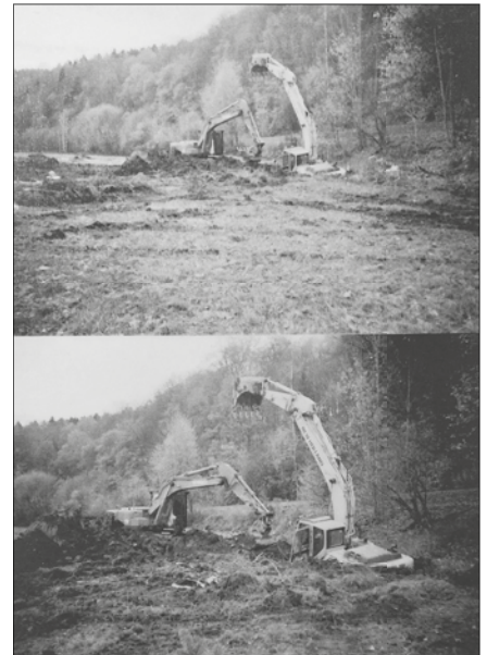
Bei Renaturierungsmaßnahmen der Walke im Oktober 2017 versank der Abrissbagger im verschütteten Betriebswassergraben und konnte nur durch Herbeiholung eines weiteren Baggers befreit werden.

Das steigende Grundwasser bei starkem Regen oder Hochwasser setzten dem alten historischen Gemäuer stark zu. Die letzten Mieter, Familie Weigelt und Chapals, hatten das Haus im Sommer 2017 frei gezogen. Der Denkmalschutz hegte schon länger kein Interesse mehr daran und somit konnte die städtische Wohnungsverwaltung- und -baugesellschaft Flöha das Gebäude für 30 000,- Euro abreißen und renaturieren. Das letzte Bergbaugebäude war somit Geschichte. Es hatte bis zum Schluß keinen Trink- und Abwasseranschluß. (5)