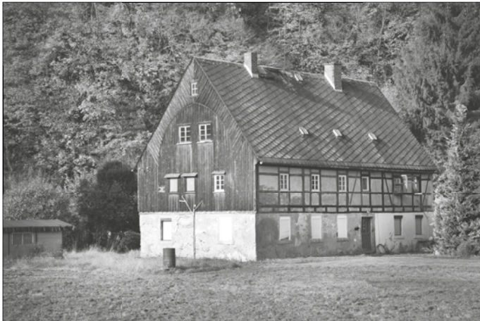
Das Anwesen der alten Schmelzhütte beinhaltete nach wechselvollen Besitzverhältnissen das Wohnhaus „Alte Walke“. Es war eines der ältesten erhaltenen Wohnhäuser von Falkenau.

Die Grundstücksgröße betrug 1200 Routen (ca. 5000 qm) und ist in der Oederkarte von 1586 – 1602 bereits als Walkmühle verzeichnet. Der Käufer bereute jedoch später den Verkauf und hatte um Rückkauf petitioniert. (2)