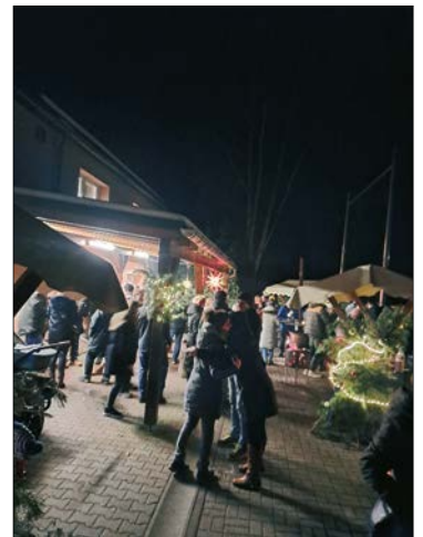
Weihnachtspektakel in Frankenstein

Und wieder haben sich die Organisatoren etwas Neues einfallen lassen. Im Anschluss an das Adventskonzert waren alle Einwohner eingeladen, zum ersten Mini-Weihnachtsmarkt nach Frankenstein zu kommen. An kleinen geschmückten Ständen gab es Glühwein, Grillwurst, Crêpes und sogar kleine Geschenke zu kaufen. Für die Kinder gab es Knüppelteig und in der Halle wurde gebastelt und geschminkt. Über die große Resonanz waren die Narren mehr als erstaunt. Die Gäste haben die gemütliche Stimmung, die Schlichtheit und die Möglichkeit zum gemeinsamen Feiern mehr als geschätzt. Ein Volltreffer in den Augen aller Beteiligten. Es ist nicht ausgeschlossen, diese Idee im nächsten Jahr auszubauen.